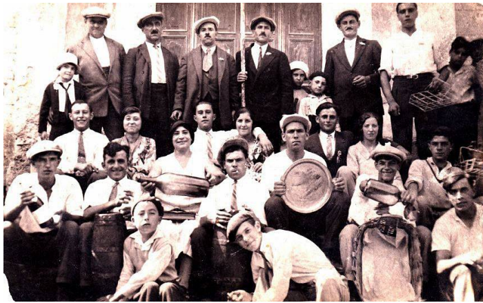
Orchestre et comité des fêtes en 1935.