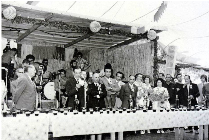
Apéritif d'honneur en 1973.