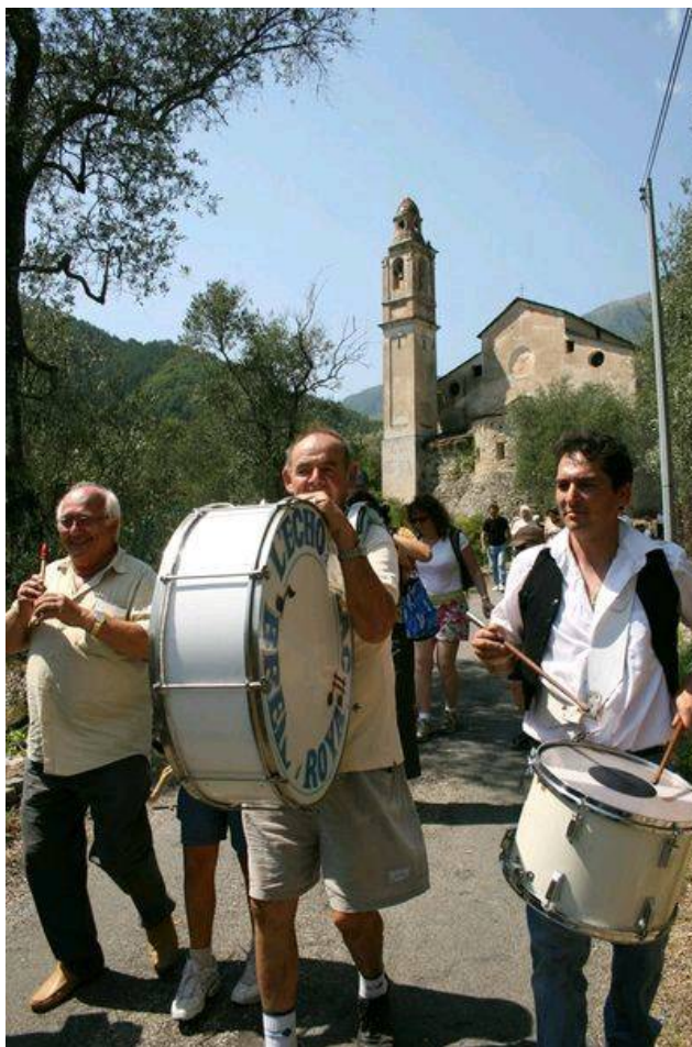
Musique populaire en tête de la descente vers le village le 16 août.