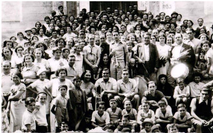
Sortie de messe à la Madone du Mont en 1935.