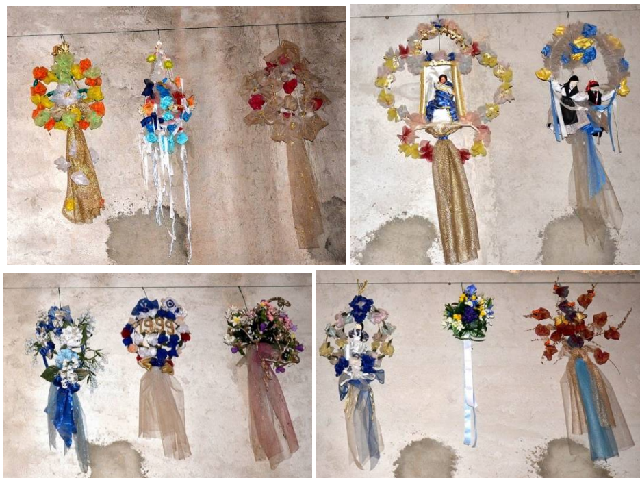
Cocardes mariales, fabriquées annuellement, bénies à l'occasion de la Médjagoust, puis accrochées au mur de la Madone du Mont chaque 16 août.