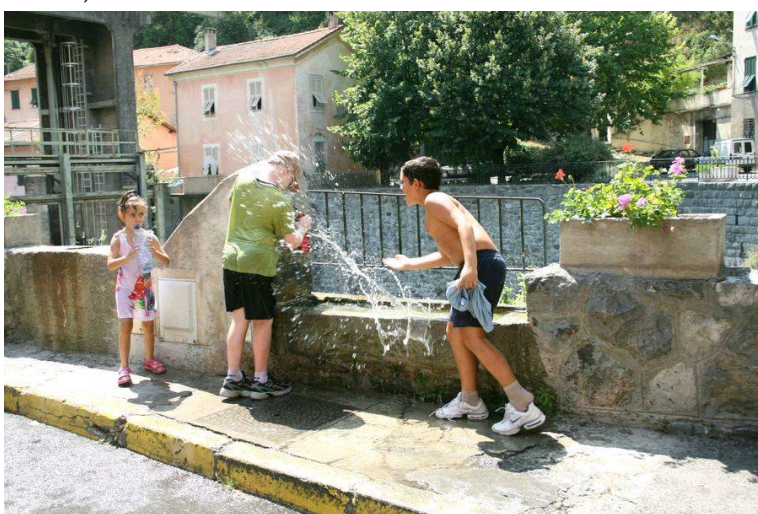
Aspersion à une fontaine du village le 16 août.