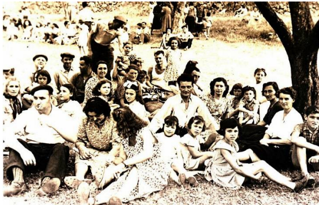
Pique-nique sous les oliviers de la Madone du Mont en 1950.