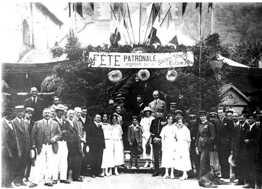
Comité des fêtes posant devant le chapiteau festif en 1929.