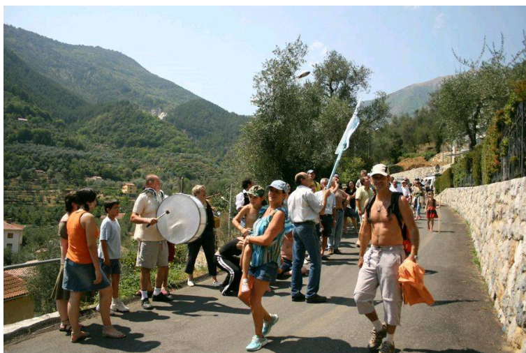
Musique populaire en tête de la descente vers le village le 16 août.