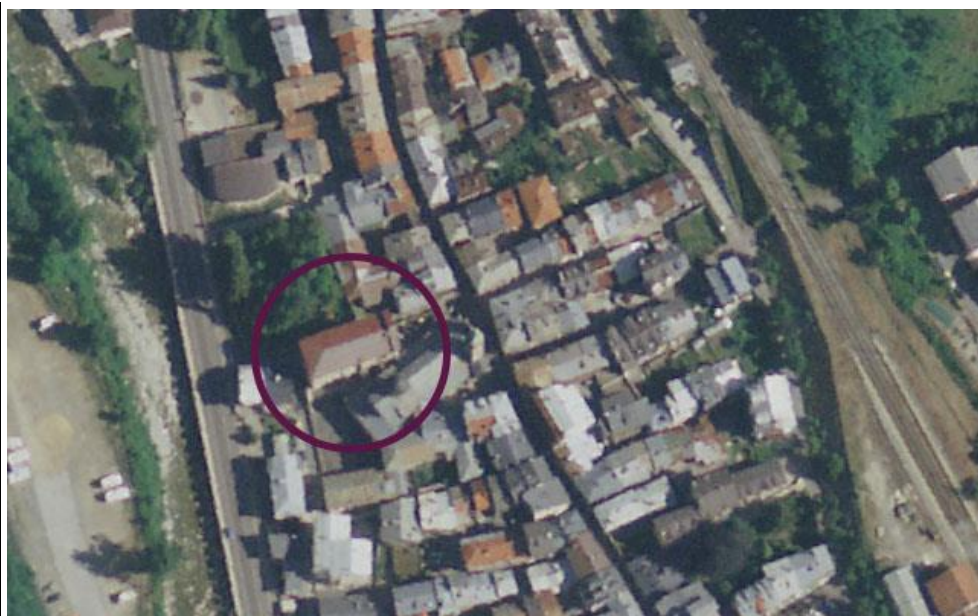
Ortofoto del Museo Attilio Mussino – scala 1:1,000 (www.pcn.minambiente.it/viewer/ e s.m.i.)