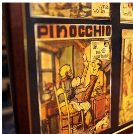
Un'illustrazione conservata nel museo.