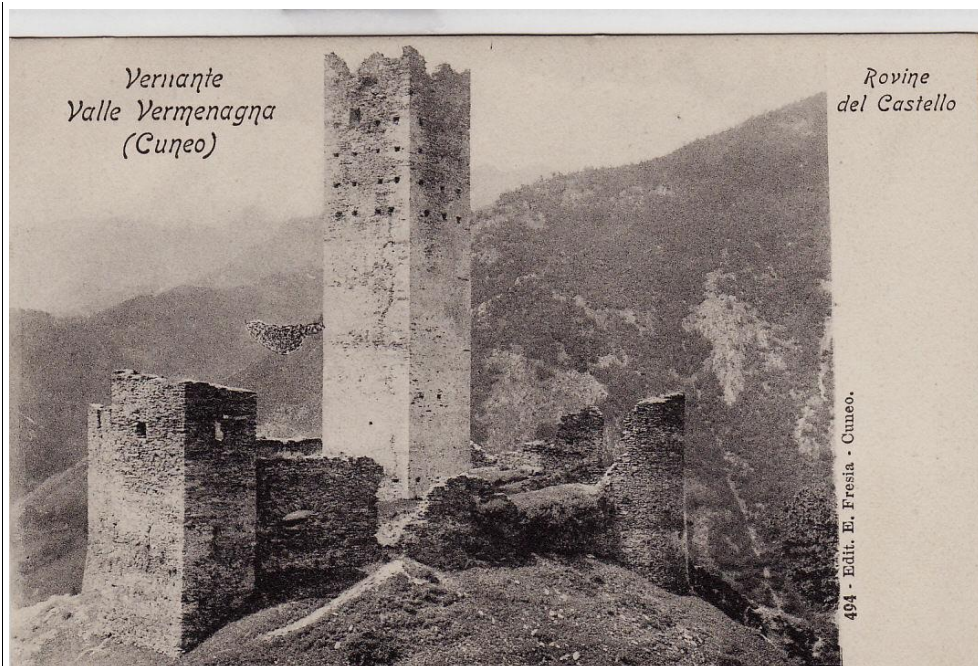
Una cartolina del 1941.