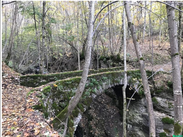
Ponte in pietra lungo il percorso.