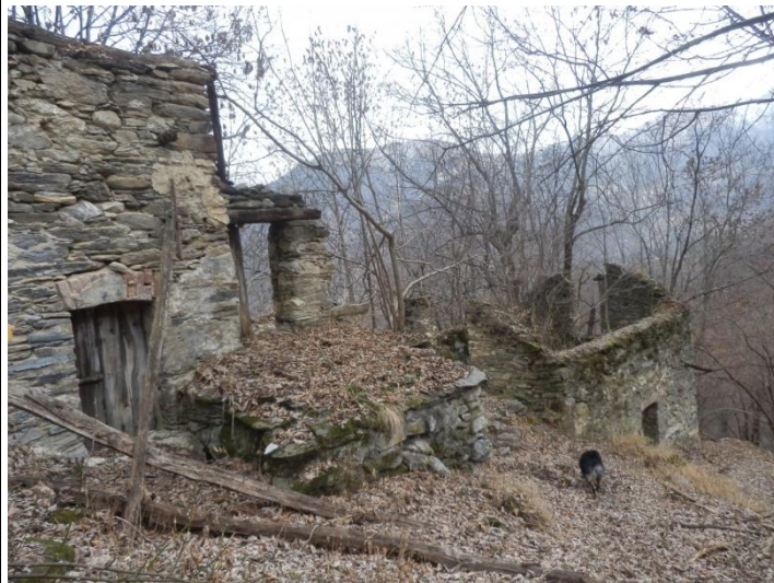
Teit Duca lungo l'anello.