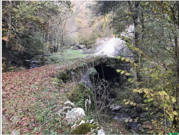
Ponte in pietra lungo il percorso.