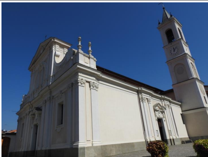
Chiesa parrocchiale Visitazione di Maria Vergine, da via Roma.