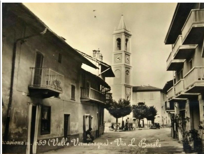
Cartolina con scorcio del campanile, 1960