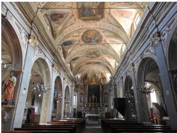
Chiesa parrocchiale Visitazione di Maria Vergine, le navate.