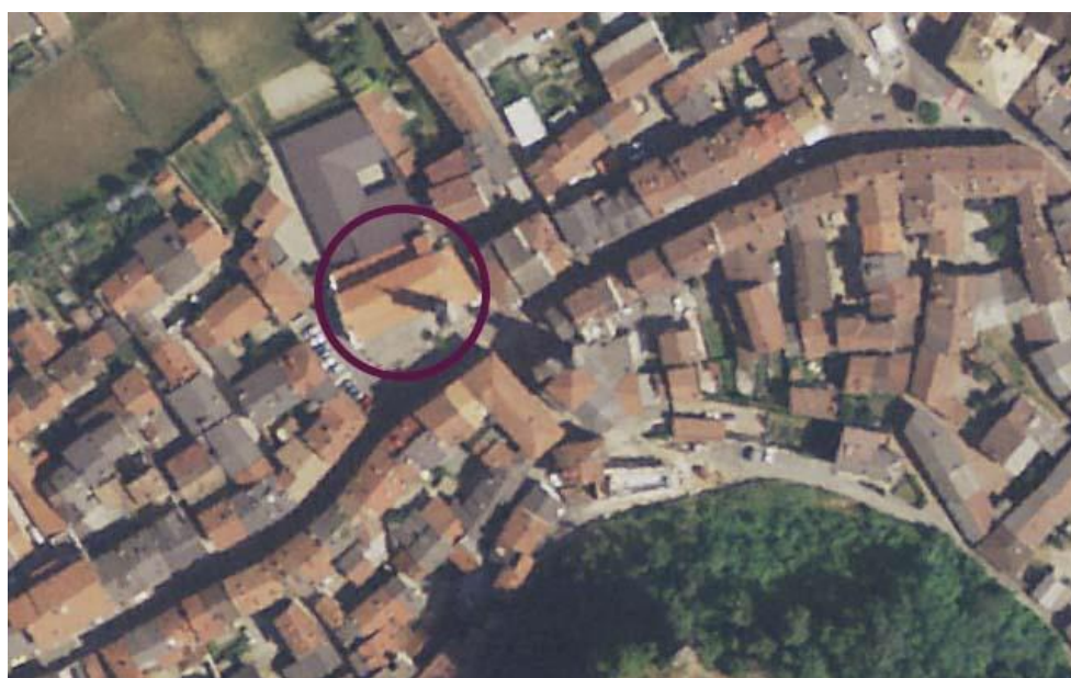
Ortofoto della Chiesa parrocchiale - scala 1:1000 ( www.pcn.minambiente.it/viewer/ e s.m.i.)