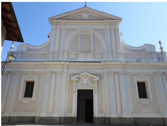
Chiesa parrocchiale Visitazione di Maria Vergine, la facciata.