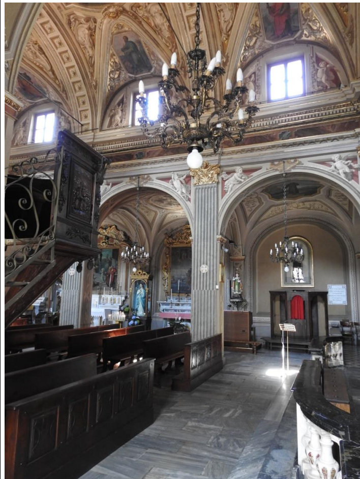
Chiesa parrocchiale Visitazione di Maria Vergine, il pulpito e il presbiterio.