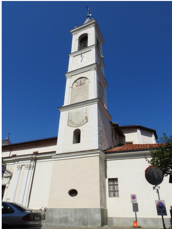
Chiesa parrocchiale Visitazione di Maria Vergine, il campanile.