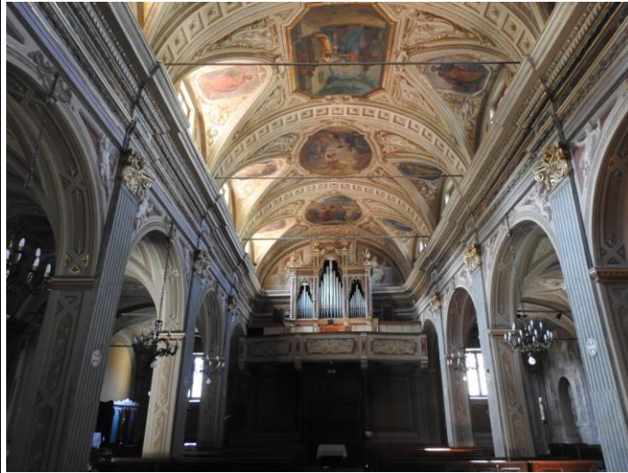
Chiesa parrocchiale Visitazione di Maria Vergine, l'organo.