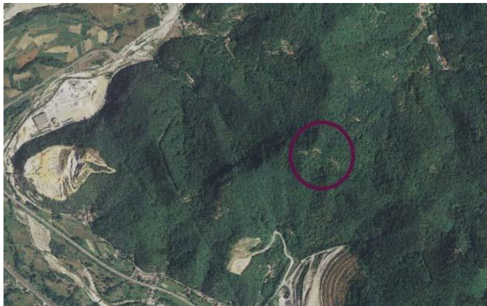
Ortofoto del sito protostorico - scala 1:1000 ( www.pcn.minambiente.it/viewer/ e s.m.i.)