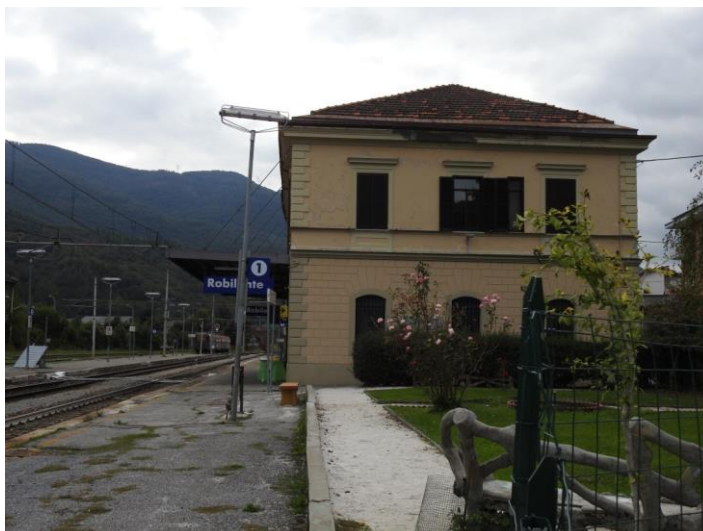
La stazione di Robilante che ospita il museo.