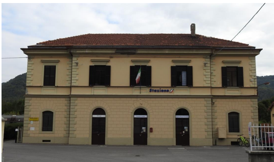
L'ingresso al museo.