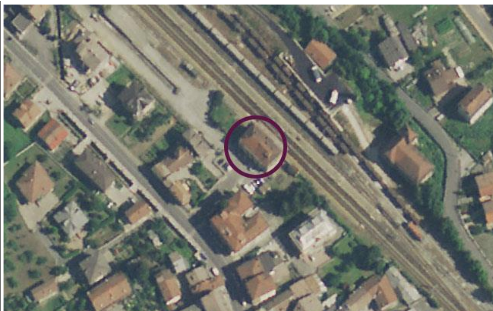
Ortofoto del Museo della Cuneo-Nizza – scala 1:1000 (www.pcn.minambiente.it/viewer/ e s.m.i.)