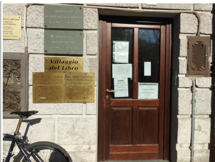
L'ingresso al museo.