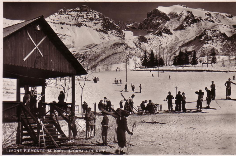
Campo Principe, 1936 [picclick.it]