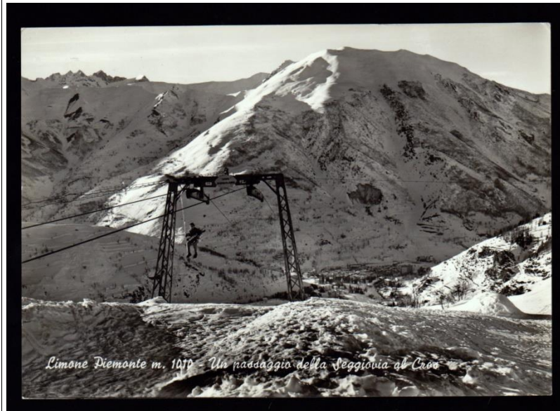
Seggiovia al Cros, 1965