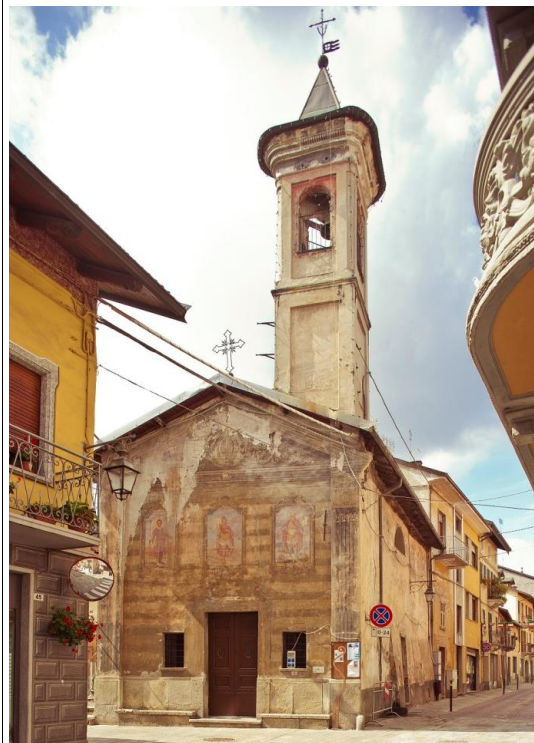
Chiesa della Confraternita di San Magno.