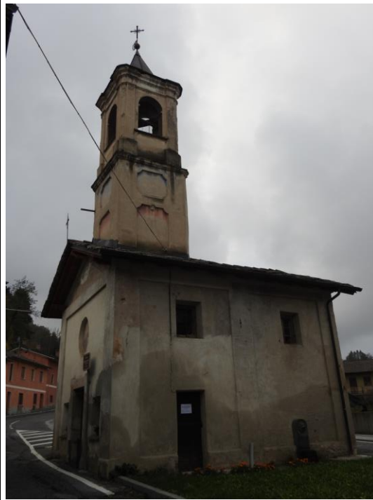
Cappella della Madonna delle Grazie.