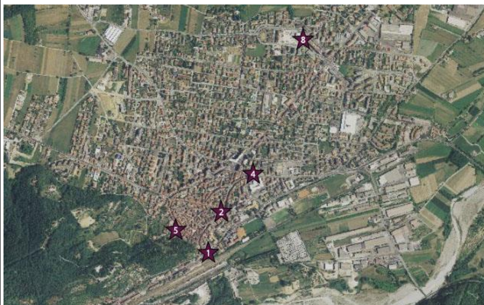
Ingrandimento della dislocazione delle chiese minori e cappelle sul centro cittadino borgarino - scala 1:10.000 (www.pcn.minambiente.it/viewer/ e s.m.i.)