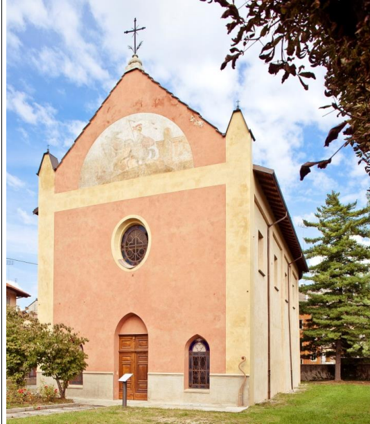
Chiesa di Sant'Anna.