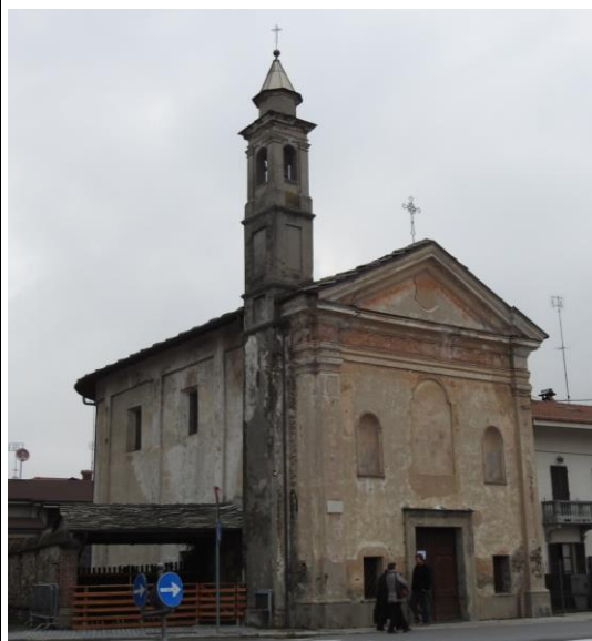
Cappella di San Rocco.