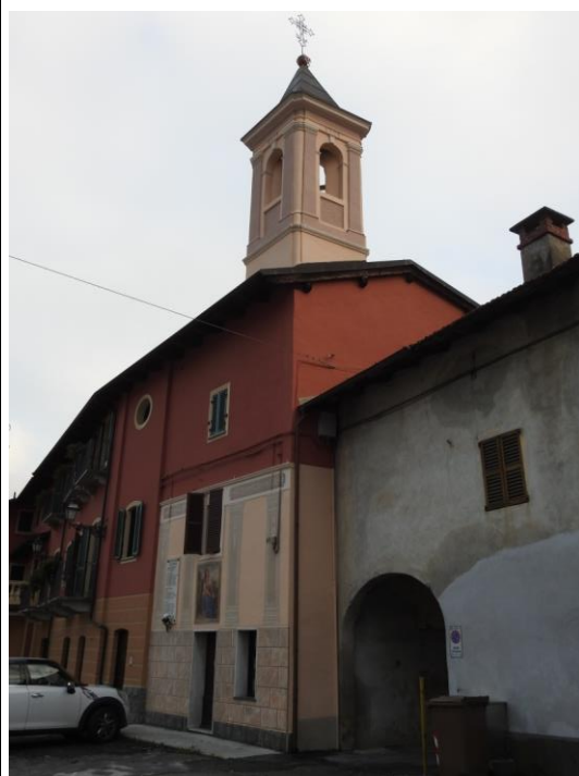
Cappella della Madonna della Neve.