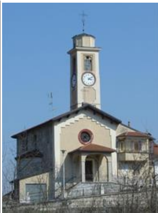
Chiesa di Madonna Bruna.