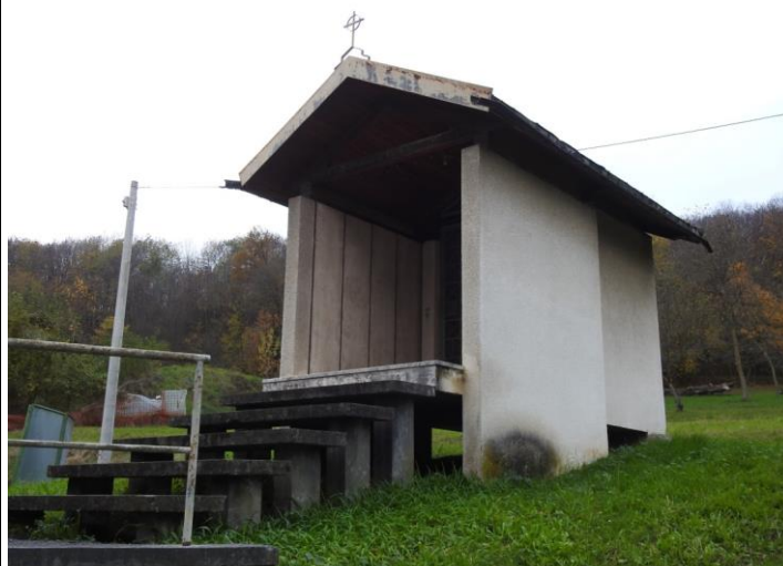
Cappella della Madonna del Buon Viaggio.