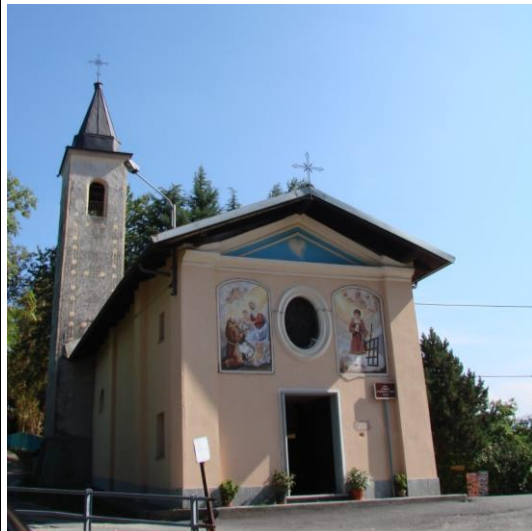
Cappella di Sant'Antonio Aradolo.