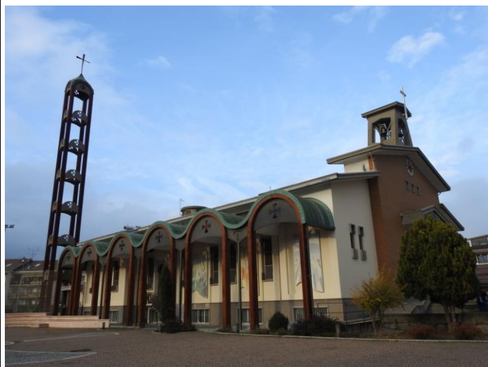
Chiesa parrocchiale di Gesù Lavoratore.