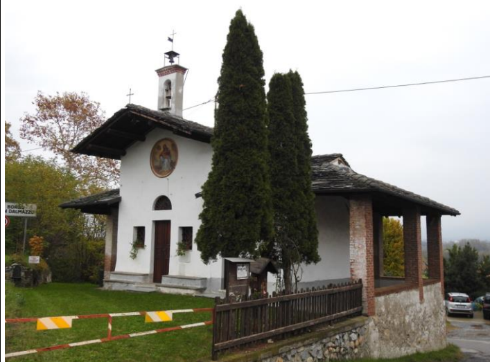
Cappella della Crocetta.