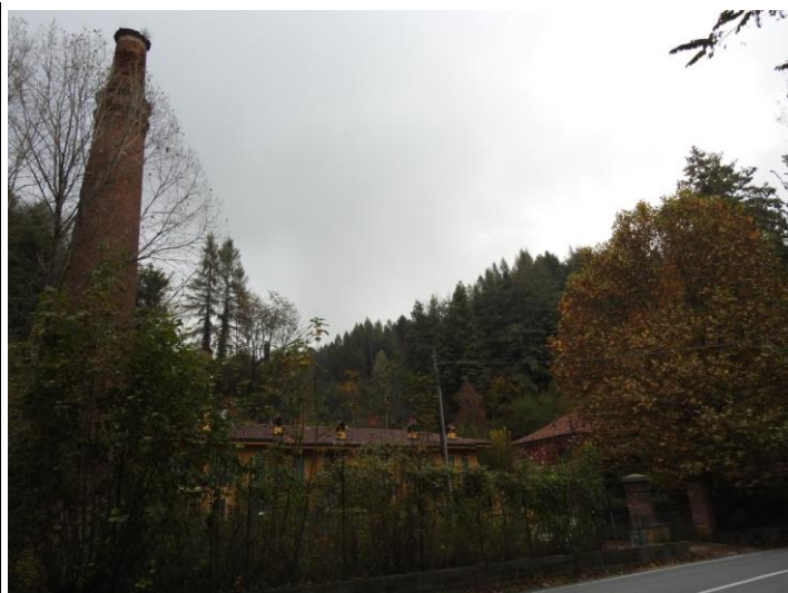
Fornace Musso [2]