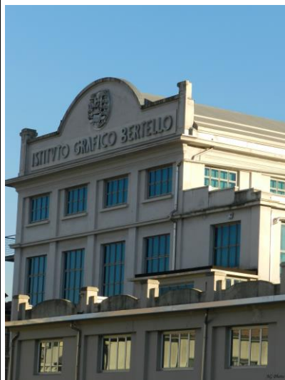
Ex stabilimento Bertello [4]