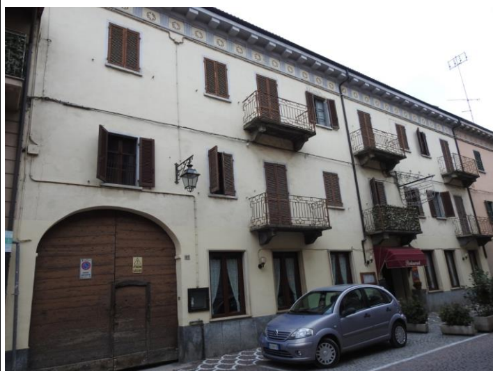
Fabbrica di Birra Parola [3]