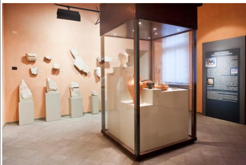
La sala II e i reperti romani trovati nell'area.