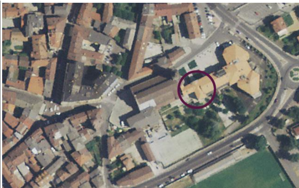
Il Museo dell'Abbazia di Borgo San Dalmazzo – scala 1:1.000 ( www.pcn.minambiente.it/viewer/e-s.m.i. )