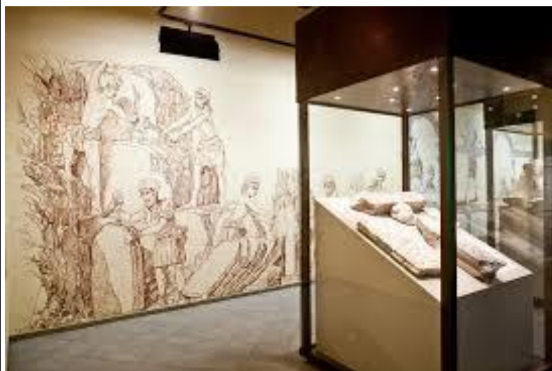
La sala III con la ricostruzione della recinzione presbiteriale.