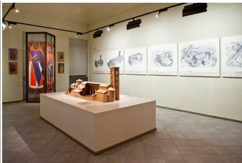
La sala I con l'evoluzione stratigrafica del sito.