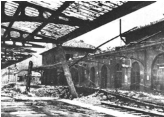
Vue de la gare de Breil partiellement détruite pendant la guerre.