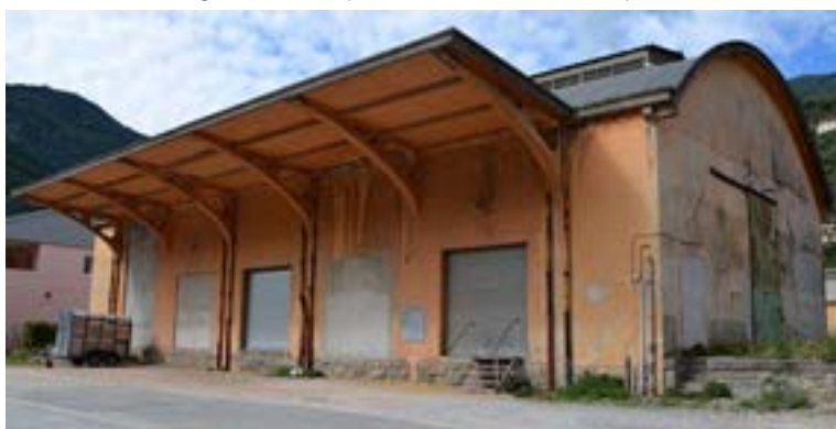
Ancien hangar SNCF désaffecté.