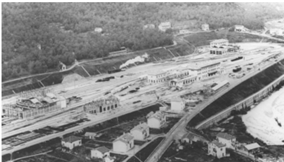
Vue, depuis le sud-est, du plateau de la gare achevé. Les hangars sud sont en cours de construction.