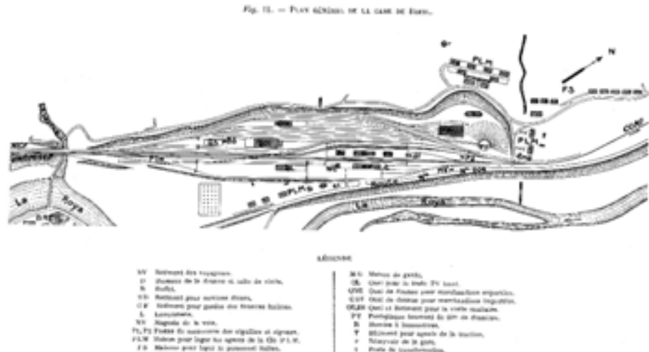
Plan du plateau de la gare de Breil, lors de la mise en service en 1928.