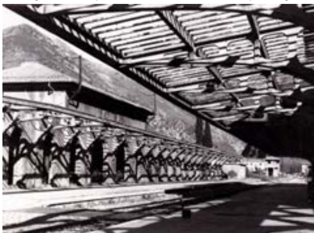
1978 : bâtiment du quai 2 avec sa verrière avant sa démolition.