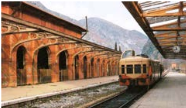
1948 : gare de Breil partiellement remise en service après la guerre.