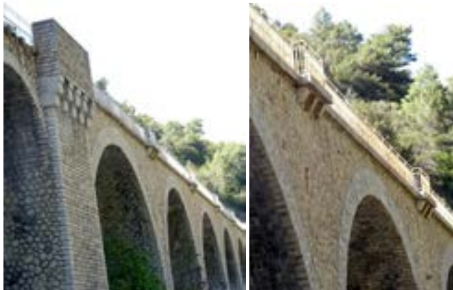
Vues des refuges en encorbellement sur corbeaux le long du viaduc des Eboulis.