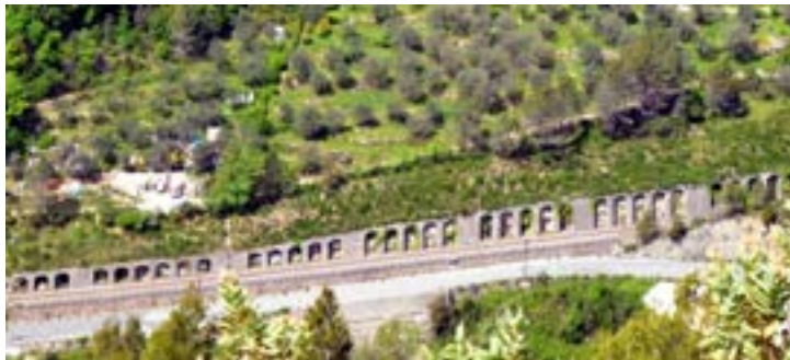
Vue partielle du long mur de soutènement en maçonnerie de pierres, doté d'arcades de raidissement, implanté en amont des voies au quartier Arbousset, au nord de l'ancienne frontière du Riou, à Piène.