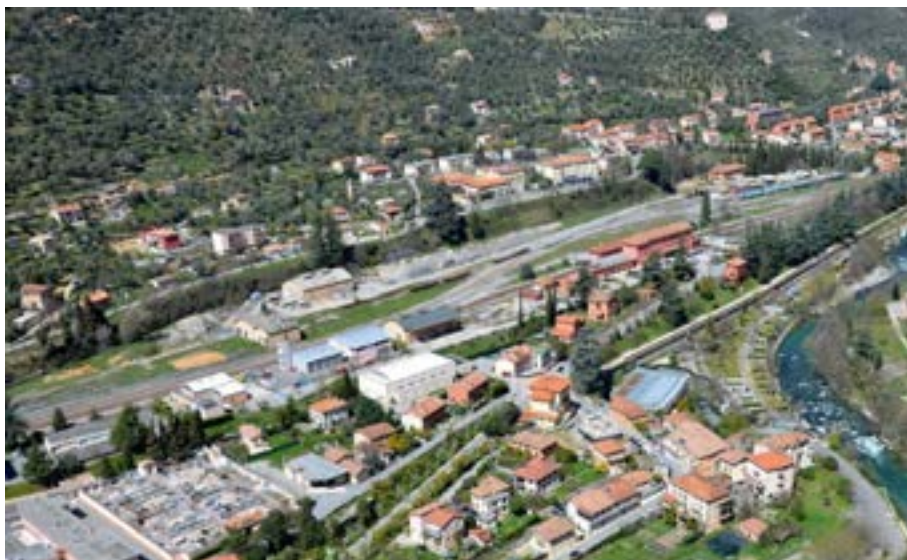
Vue actuelle du plateau de la gare depuis le sud-est.