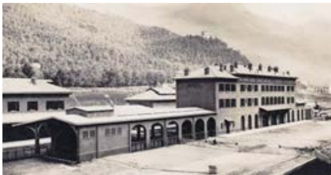
Vue de la gare de Breil récemment achevée.