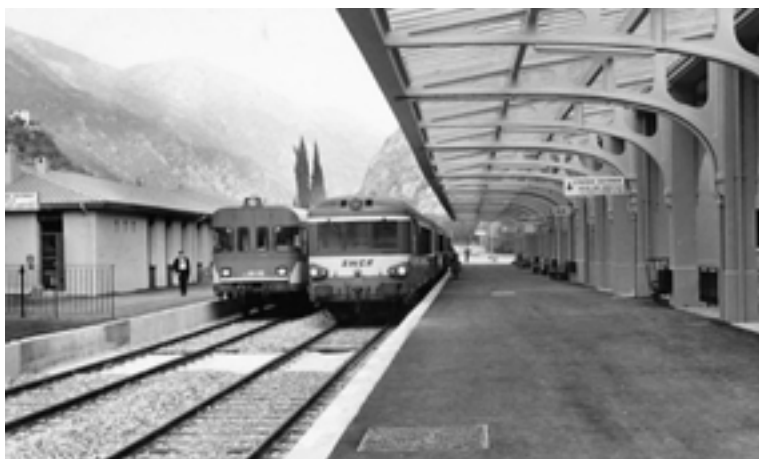
1979 : réouverture de la ICuneo – Ventimiglia avec nouveau bâtiment quai 2.