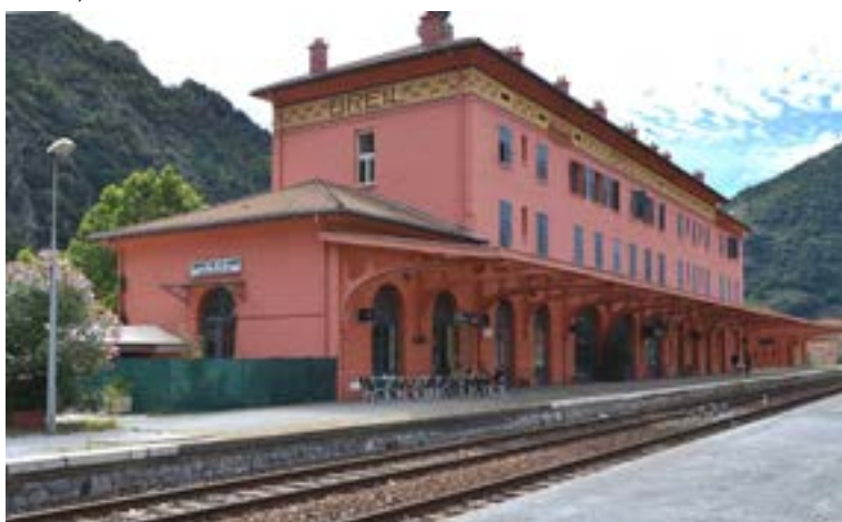
Vue actuelle de la gare de Breil.