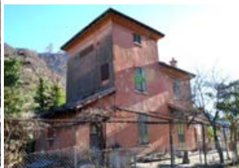
Maison du garde-barrière au passage à niveau de la gare en 1929. Vue actuelle de l'ancienne maison du garde-barrière au passage à niveau de la Giandola.