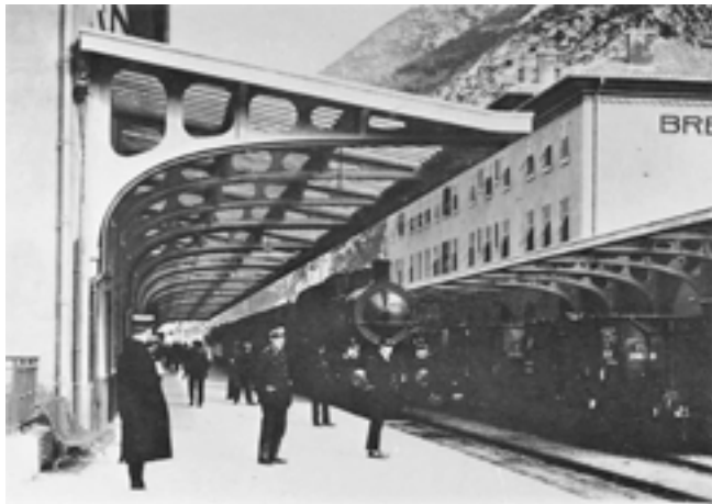
Croisement de trains dans la gare de Breil peu après sa mise en service.