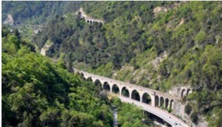
Au premier plan le viaduc des Eboulis vers Ventimiglia et au second plan le viaduc de Bancau vers Nice.