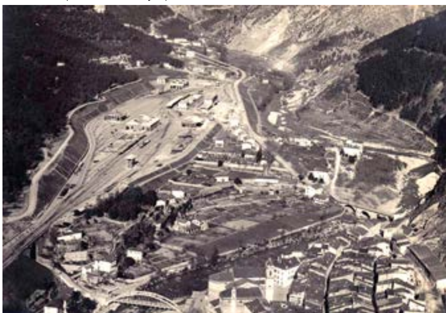
Vue depuis le sud du plateau de la gare récemment achevé en 1928.