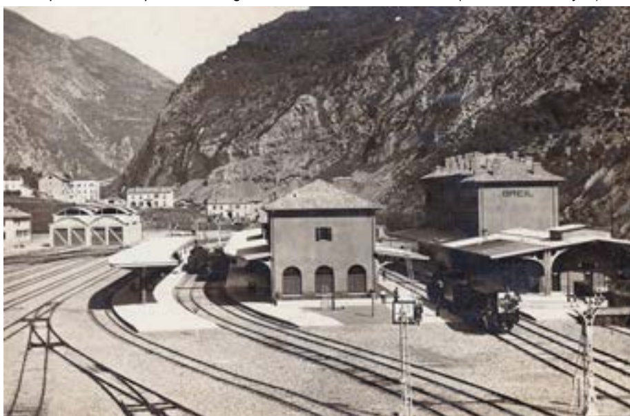
Vue de la gare de Breil récemment mise en service, avec ses trois quais voyageurs desservant 5 voies au service des passagers.