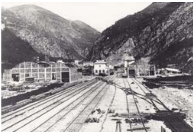
Vue des hangars sud en chantier.