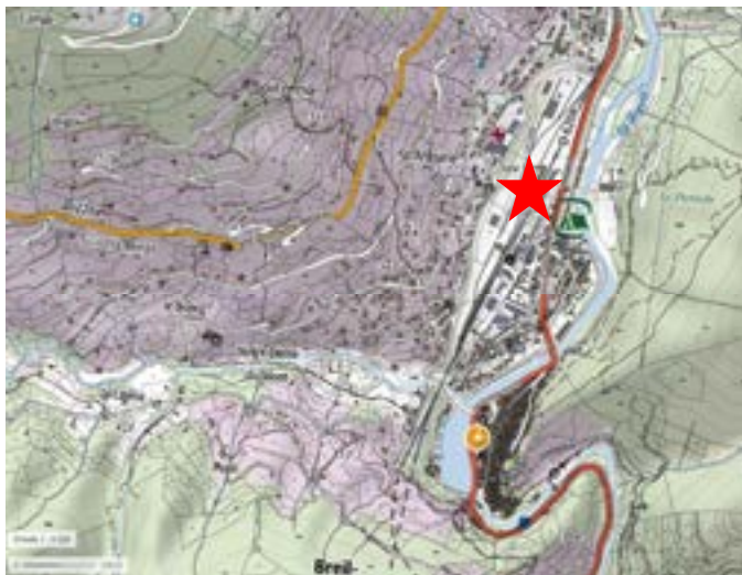
Localisation de la gare de Breil.