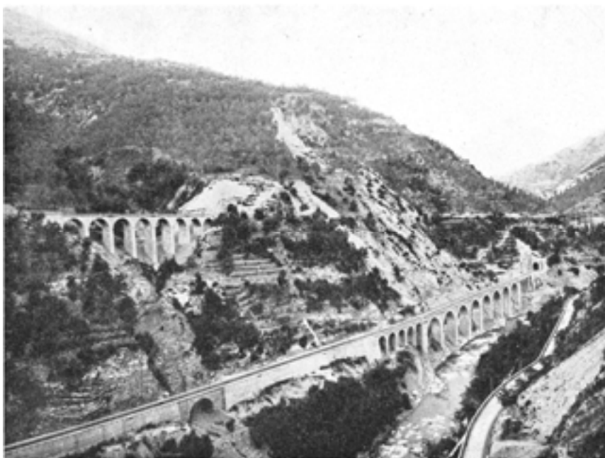
Viaducs de Bancau (en haut, vers Nice) et des Eboulis (en bas vers Ventimiglia) peu après leur mise en service.