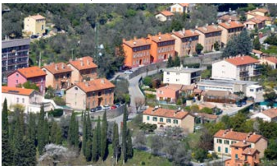
Vue actuelle des cités au quartier Saint-Pierre.