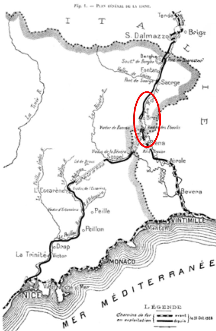
Localisation de Breil-sur-Roya sur la carte du réseau ferroviaire Nice/Ventimiglia - Torino