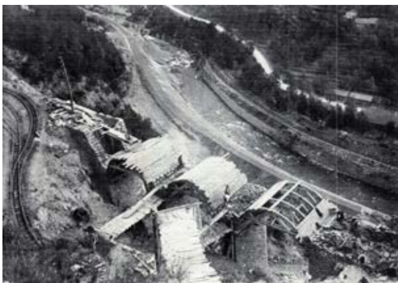
1921, chantier du petit viaduc de l'Arbousset (au sud de Breil).