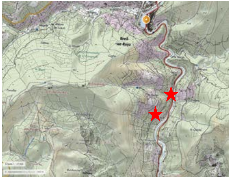
Localisation des viaducs des Eboulis et de Banca.