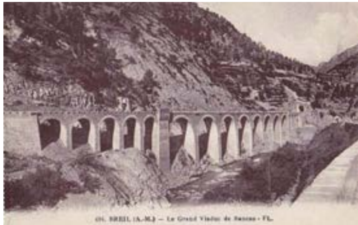
Viaduc des éboulis. On observe entre les séries d'arcades différentes, des piles renforcées formant des sortes de pilastres dont la tête constitue un refuge en encorbellement, supporté par des corbeaux créant un décor en relief.