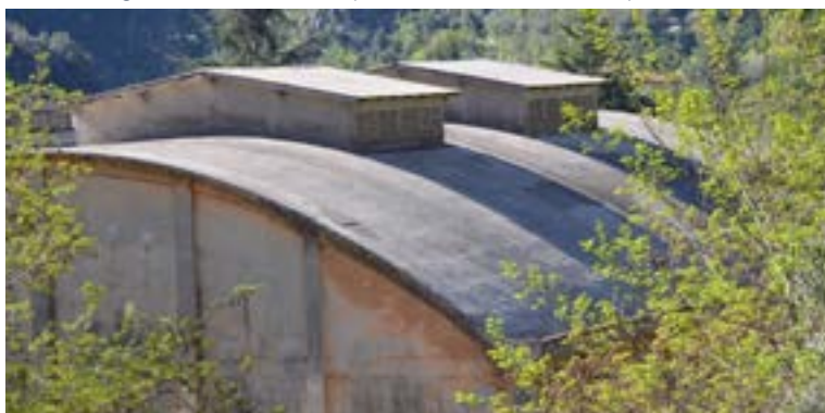
Lanterneaux de ventilation des hangars.