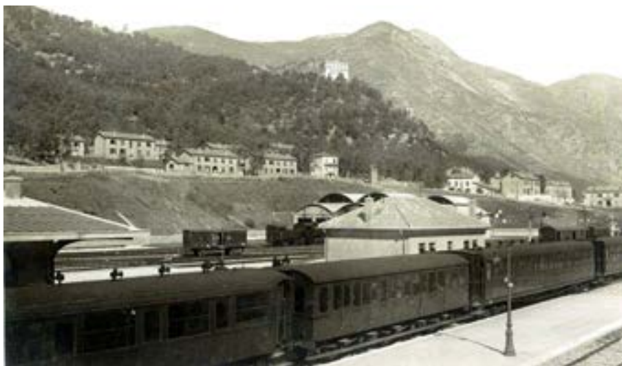
Vue des « cités » de logements construites par la PLM aux quartiers Burdanches et Saint-Pierre en 1929.