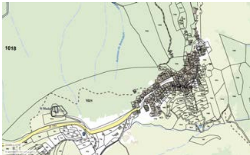
Plan du hameau de Piène-Haute.