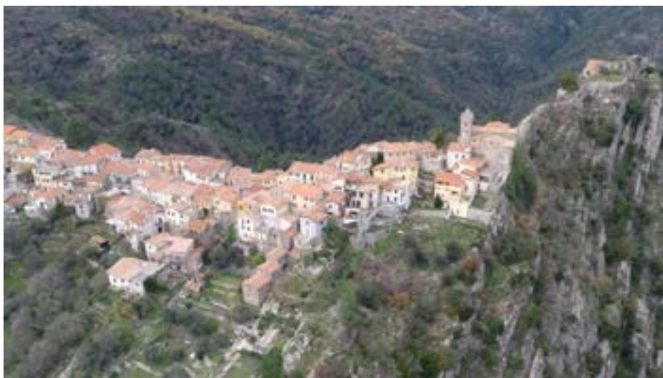
Vue aérienne depuis le sud-est.