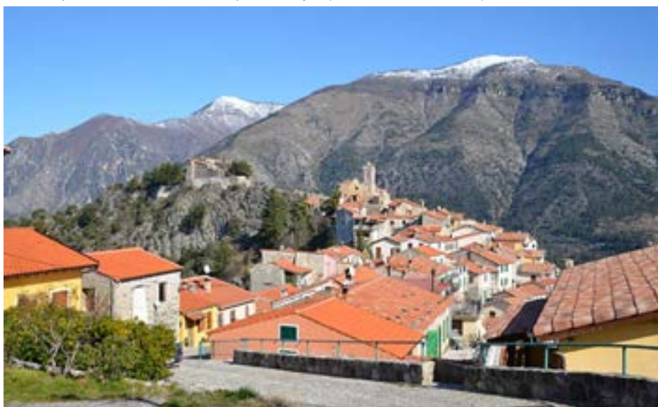
Vue du hameau depuis la voie d'accès, à l'ouest.