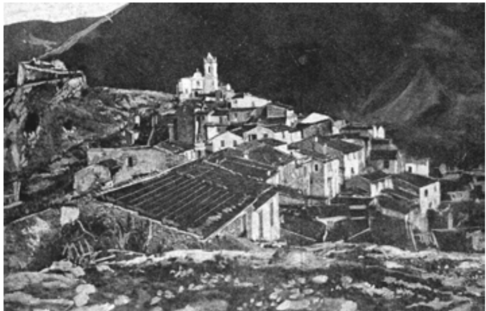
Vue de Piène et du château en 1914