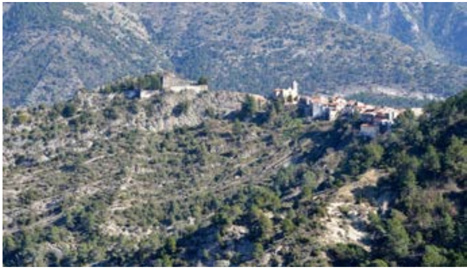
Vue du château de Piène et de son château, depuis le nord-ouest, côté vallon du Riou.