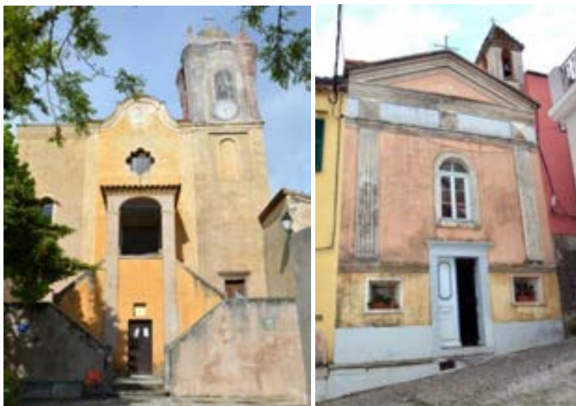
Eglise Saint-Marc.