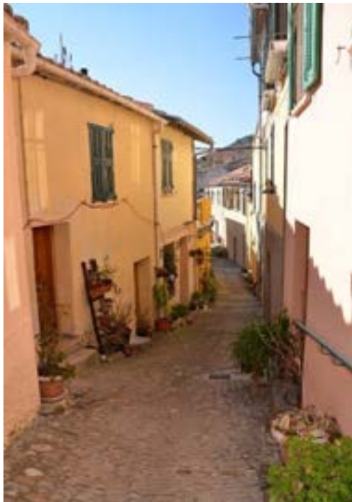
Vue intérieure du hameau.