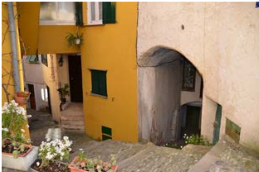
Vues intérieure du hameau.