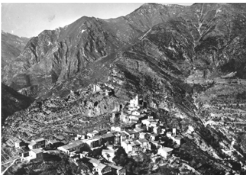
Vue aérienne de Piène depuis le sud-ouest, en 1962.