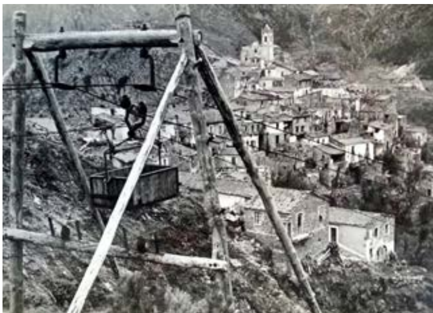
Vue de Piène et du téléphérique en 1948.