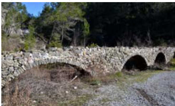
Pont-siphon de la pointe Costéra, qui permettait à l'eau de franchir un vallon, pour alimenter le village d'Olivetta.