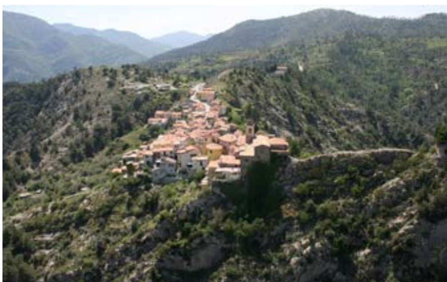
Vue aérienne du hameau de Piène-Haute, depuis l'ouest (côté Roya).